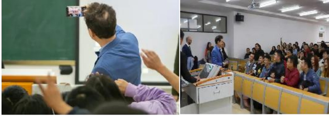
(法国驻武汉前总领事贵永华先生与中法班学生面对面)