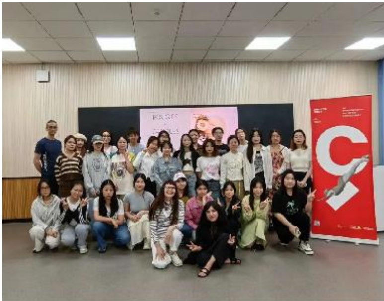
(中法班学生积极参与法国高教署组织的各项活动)